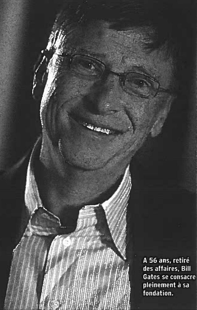
A 56 ans, retiré des affaires, Bill Gates se consacre pleinement à sa fondation.

La deuxième fortune mondiale bouleverse les règles de la philanthropie en appelant les plus riches à redistribuer leurs biens.